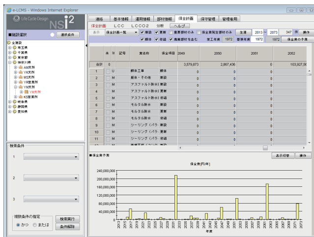
保全費予測グラフ

既存建物は、建物劣化診断調査を行い、専門家が中長期保全計画をNSi 2 サービス上で立案します。